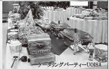
ケータリングパーティーUOISA