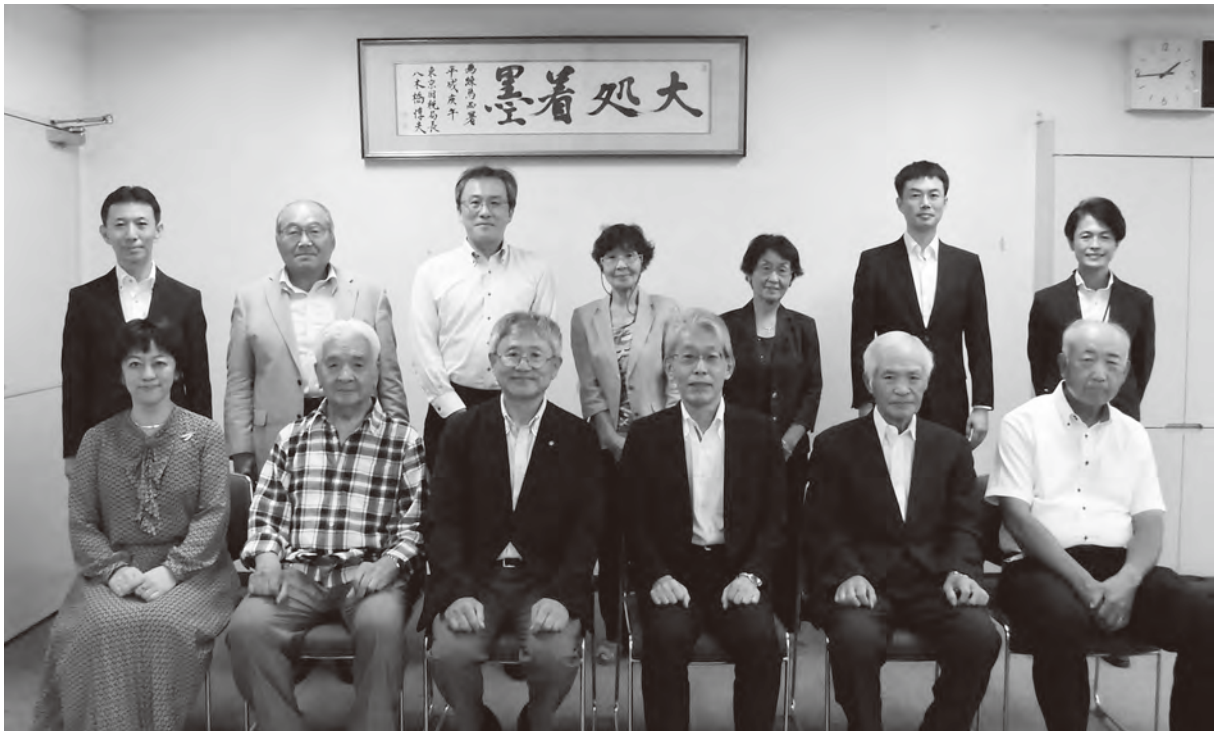
練馬西税務署新幹部との名刺交換会に於いて